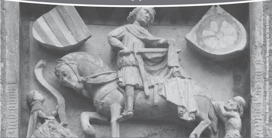
Minus Relief (Balbus, Frutze)