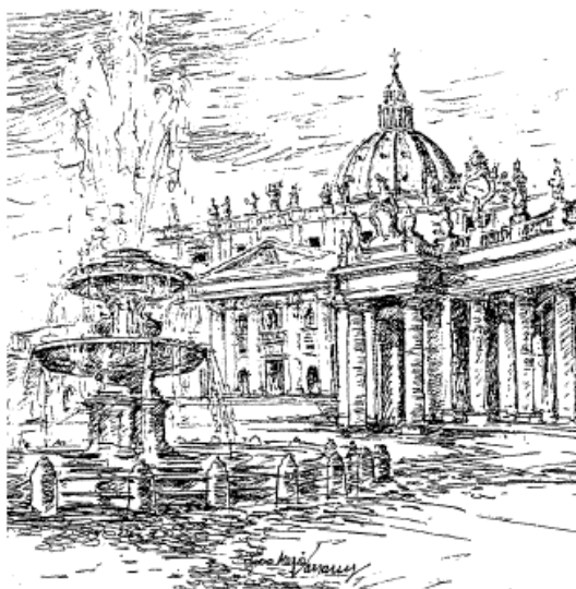
Rom - Petersdom